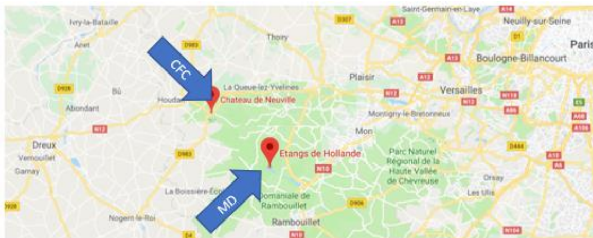
Carte – Localisation lieu CFC

Depuis Saint-Léger-en-Yvelines : D112 ou D983