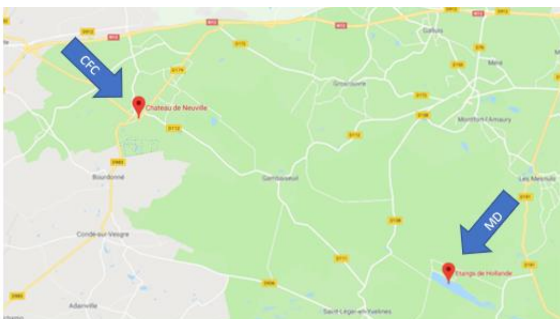
Carte – Zoom localisation lieu CFC